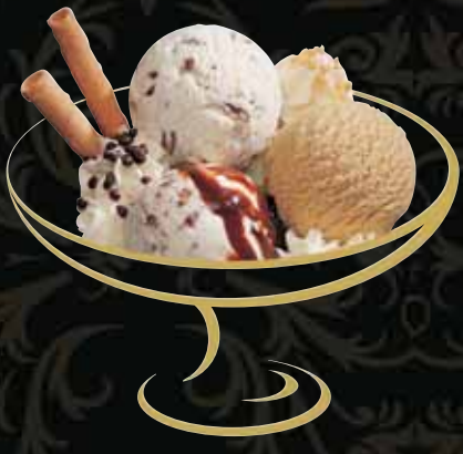
STÄINÄMEDER Stracciatella, Mocca Fr. 9.50 Mini: Fr. 7.00