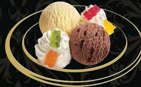
BÄRLI Vanille, Chocolat Fr. 6.00