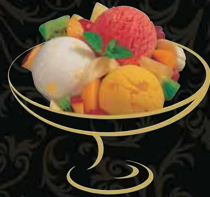
DUCAN Sorbet Blutorange, Citron, Mango Fr. 10.50