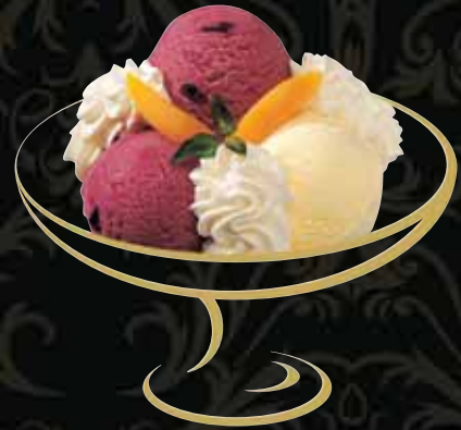
GIPFELSTÜRMER Vanille, Sorbet Cassis Fr. 9.50 Mini: Fr. 7.00