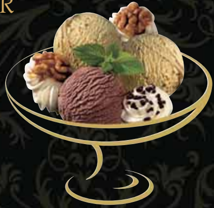
JÄGER Nussanoix, Chocolat Fr. 9.50 Mini: Fr. 7.00