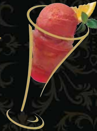
SONNENUNTERGANG Sorbet Blutorange mit Grand Marnier Fr. 10.50