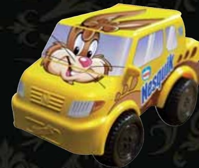
MONSTEINER-POSTAUTO Vanille-Schokoladen Glace Auto zum Spielen Fr. 5.50