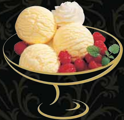
MUNGGA-BECHER Vanille mit warmen Himbeeren Fr. 10.50 Mini: Fr. 8.00