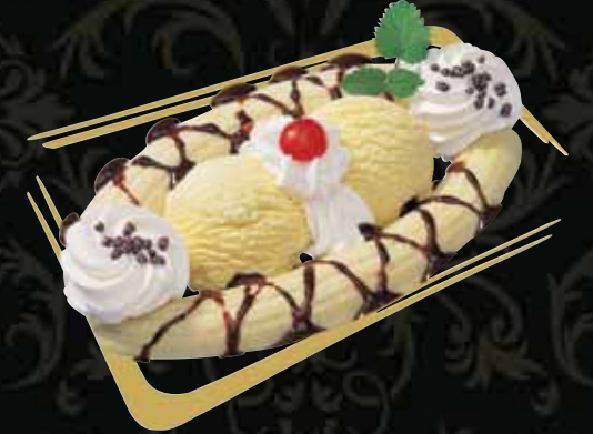
BANANA SPLIT 1 Kugel Banane, 1 Kugel Vanille mit Schokoladensauce Fr. 10.50