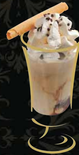
EISKAFFEE Mocca Fr. 9.50