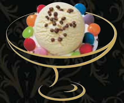
FLÄCKLI Vanille Fr. 4.50