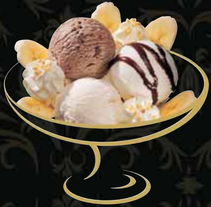
GUFER Banane, Chocolat Fr. 9.50 Mini: Fr. 7.00