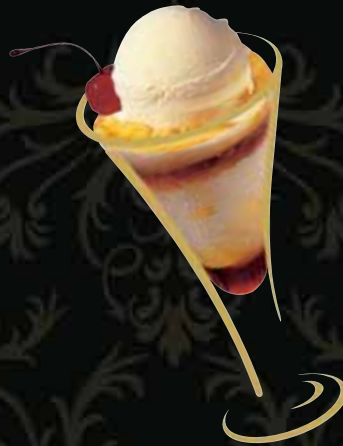
FRAUENTRAUM Vanille mit Baileys Fr. 10.50